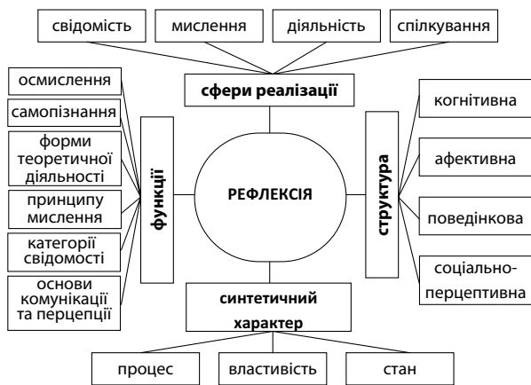
Схема 1. Сутність рефлексії як психологічного феномену

Підкреслимо, що для педагогічного трактування типів рефлексії у контексті професійної рефлексії майбутнього педагога вагомими є психологічні підходи щодо трактування типів рефлексії , серед яких розрізняють такі: 1) кооперативну, комунікативну, особистісну, інтелектуальну (І. Семенов та С. Степанов); 2) інтрапсихічну та інтерпсихічну (за спрямованістю) (А. Карпов, Д. Леонтьєв); 3) ситуативну, ретроспективну, перспективну (за часовим критерієм) (А. Карпов, А. Шаров).