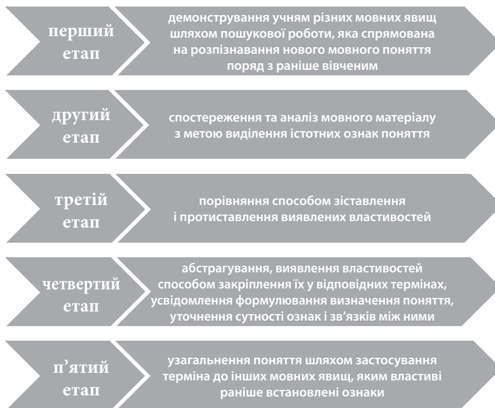
Рис. 2. Етапи засвоєння мовних понять

Серед вправ і завдань, що сприяють формуванню в учнів старшої школи мовних понять, нами було виокремлено такі: