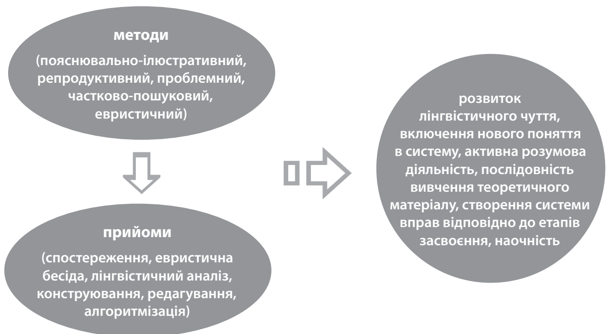
Рис. 1. Методичні умови ефективно організації роботи над формуванням мовних понять в учнів ЗНЗ під час навчання морфології

Показниками засвоєння морфологічного поняття є знання, що допоможуть розрізняти схожі між собою категорії; уміння застосовувати правила та наводити приклади; навички користування знаннями в ситуаціях творчого характеру.