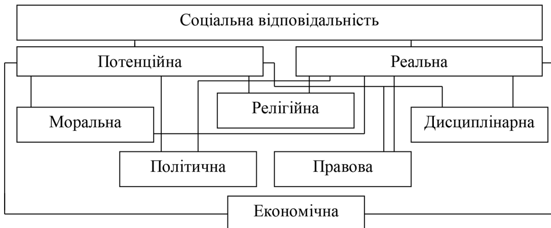
Рис. 2. Структура соціальної відповідальності

Соціальна відповідальність виступає невід'ємним елементом сучасного суспільства, де вчинки і відповідальність перебувають у постійному взаємозв'язку. А отже, вважаємо за необхідне виокремити структуру соціальної відповідальності (рис. 2).