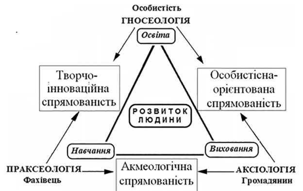
Рис. 2. Системна кореляція головних категорій педагогіки у контексті типів спрямованості педагога

до загальної теорії систем та місце у цій системі типів спрямованості викладачів ЗВО.