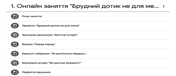
Рис. 2. Скрін вигляду онлайн заняття «Брудний дотик не для мене» на платформі G-class

Віртуальні зустрічі учасників цих занять відбуваються у режимі реального часу із використанням спеціальних платформ для віртуальної комунікації, як то ZOOM, Google Meet, Blue Jeans або інших, які можуть забезпечити відео- та аудіотрансляцію всіх учасників, а також функції чату, передачі документів, таблиць, презентацій, фотографій, інших файлів, відеовідображення робочого столу тощо. Для комфортного користування курсом обрано простий та зрозумілий формат структури заняття, де кожен елемент зручний у користуванні (Рис. 2.).