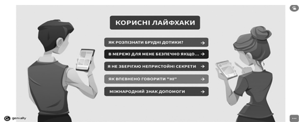
Рис. 4. Скрін вигляду «Корисних лайфхаків».

Важливим компонентом кожного онлайн заняття є «Корисні лайфхаки» (Рис. 4.). Саме лайфхаки (сленговий термін), тобто практичні підказки, які діти завантажують на власні мобільні пристрої, доможуть їм, при потребі. Корисні лайфхаки представлені у вигляді інтерактивної презентації, розробленої за допомогою онлайн інструменту Genially.