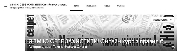
Рис. 1. Скрін вигляду онлайн курсу на платформі G-class

Авторський онлайн курс «Я вмію себе захистити» є електронним методичним посібником для роботи з дітьми, розміщеним на мережевому, віртуальному майданчику (Рис. 1).