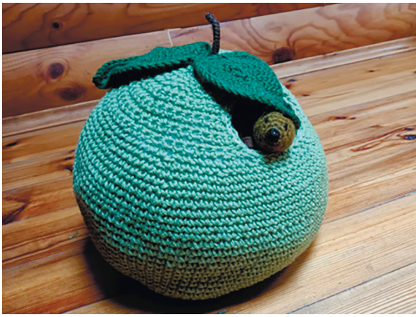
Рис. 2. Авторська іграшка «Яблуко і гусінь»