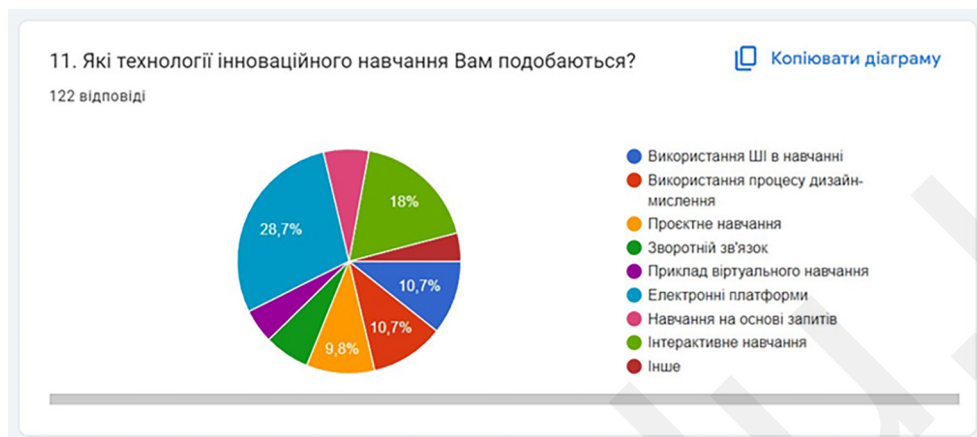
Рис. 4. Щодо вибору технологій інноваційного навчання

На сьогодні студенти вважають найбільш уживаною інноваційною практикою електронні платформи (35,2 %), штучний інтелект (24,6 %), цифрові ресурси (22,1 %) та змішане навчання (16,4 %) (рис. 4).