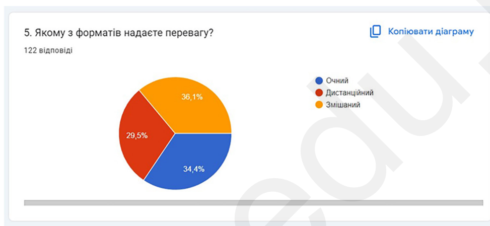
Рис. 2. Щодо пріоритетного формату навчання