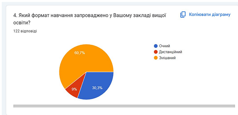
Рис. 1. Щодо запровадження форми навчання у ЗВО